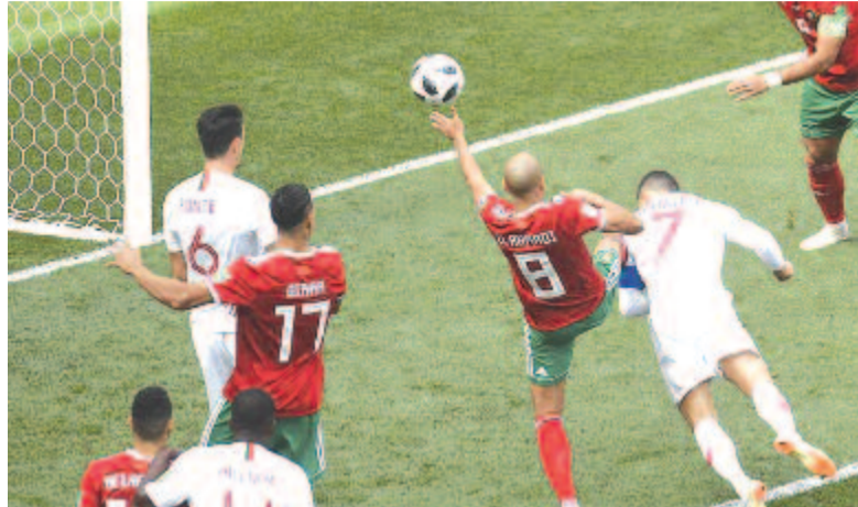
Egy szögletet követően a marokkói védők éppen a rivális legjobbjáról feledkeztek meg teljesen, Ronaldo pedig öt méterről nem hibázott. Ezzel megdöntötte Puskás Ferenc Európa-rekordját

Az Európa-bajnok portugál válogatott 1-0-ra legyőzte a marokkói csapatot szerdán a B csoport második fordulójának moszkvai mérkőzésén a labdarúgó-világ bajnokságon.