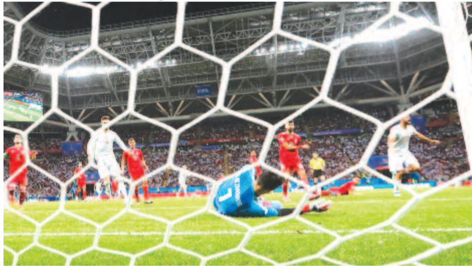
Diego Costa már a harmadik góljánál tart a világ bajnokságon

A fordulást követően rögtön nagy lehetőségek adódtak a nagyobb sebességre váltó spanyolok előtt, s bár az irániak is tudtak veszélyeztetni, egy szerencsés találatlaltal megérdemelten szerzett vezetést a vb előtt kinevezett Fernando Hierro együttese. Az irániakat nem fogta meg a hátrány, legelőig jutottak, ám a mezőnyben változatlanul irányító spanyol válogatott megtartotta előnyét, és begyűjtötte a három pontot.