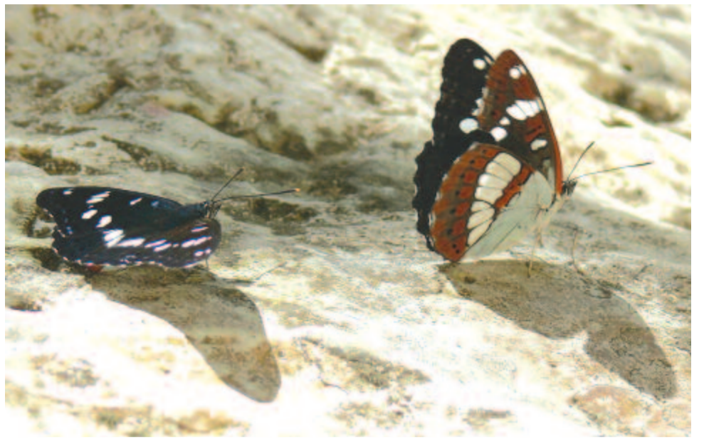
Nagy nyárfalepkék (Limenitis populi) Szent Iván-napi násztánca