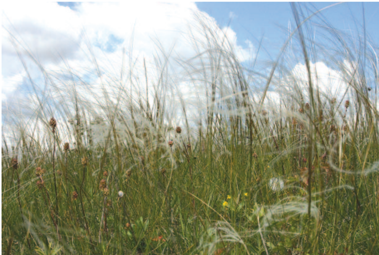
Árvánnyhajás rét Szent Ivánkor

A kuruc-labanc világban „művei a zavaros, háborús idők miatt, hozzájárulván az anyagi szükség is, kéziratban maradtak. Csak kettő jelent meg nyomtatásban” – írja Koncz