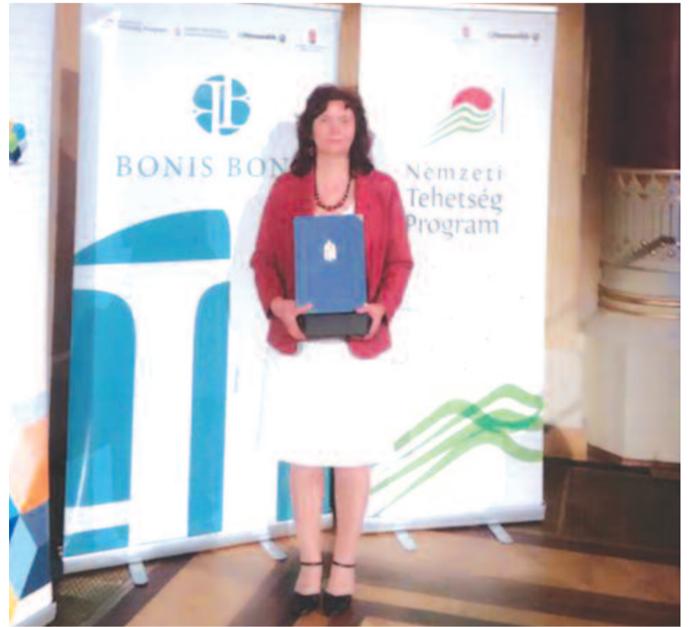
Számára a tehetséggondozás kötelesség, a munkája része, a díj pedig további munkára ösztönzi.

Fodor Flóra mintegy tíz éve foglalkozik komolyabban, tudatosan tehetséggondozással, ugyanis hamar rájött, hogy a legkisebb